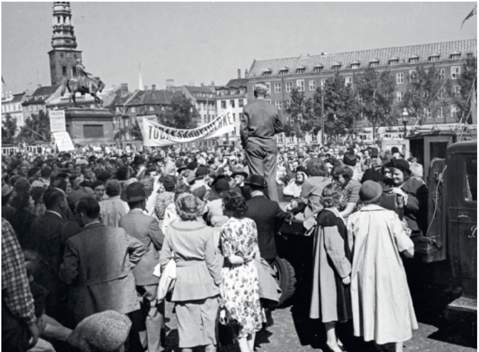
FIGUR 9. »Frederik Folkekær« har fra ryggen af sin hest i tidens løb været vidne til mange folkelige demonstrationer på Christiansborg Slotsplads; her en faglig demonstration formentlig i 1950'erne. Den vellykkede rytterstatue, som udstråler dynamik – kongen slår gavmildt og landsfaderligt ud med hånden, og hesten er i rask trav – blev skabt af billedhuggeren H.V. Bissen og fuldført af sønnen Vilhelm Bissen. Den blev afsløret ved en ceremoni i 1874, som den afdøde konges mangeårige samleverske, grevinde Danner, dog måtte nøjes med at overvære fra et af slottets vinduer, da hendes officielle tilstedeværelse ved selve ceremonien var uønsket. Kongestatuen foran folkestyrets højborg og tæt på byens mest trafikerede strøg er velkendt af enhver københavnere – ja, vel af de allerfleste danskere. Midt i folkevrimmelen står den som et varigt minde over den konge, som ved skæbnens tilskikkelse kom til at præsidere over overgangen fra enevælde til demokrati.

Disse overvejelser kunne give anledning til at fremhæve den afsluttende pointe, at enevælden i sine sidste faser faktisk langthent havde søgt at tilpasse sig det nye borgerlige samfund og dets ideologier. Selv om overgangen fra enevælde til demokrati i 1848 tilsyneladende kom med revolutionær pludselighed, var der måske derfor i grunden ikke tale om det afgørende brud med fortiden, som man kunne få indtryk af ved blot at sammenligne Kongelov og Grundlov. Den sene enevælde havde som nævnt allerede længe opfattet sig som fortolker og forvalter af folkeviljen, og allerede fra slutningen af 1700-tallet forstod styret sig selv som det egentlige og højeste udtryk for den almene folkevilje, der således blev den endelige legitimation for regimet. Dette var et udtryk for, at enevældens selvforståelse i takt med den almene europæiske udvikling havde fjernet sig så langt fra Kongelovens højstemte absolutistiske formuleringer, at disse efterhånden klingede hult og i stigende grad virkede indholdsløse.