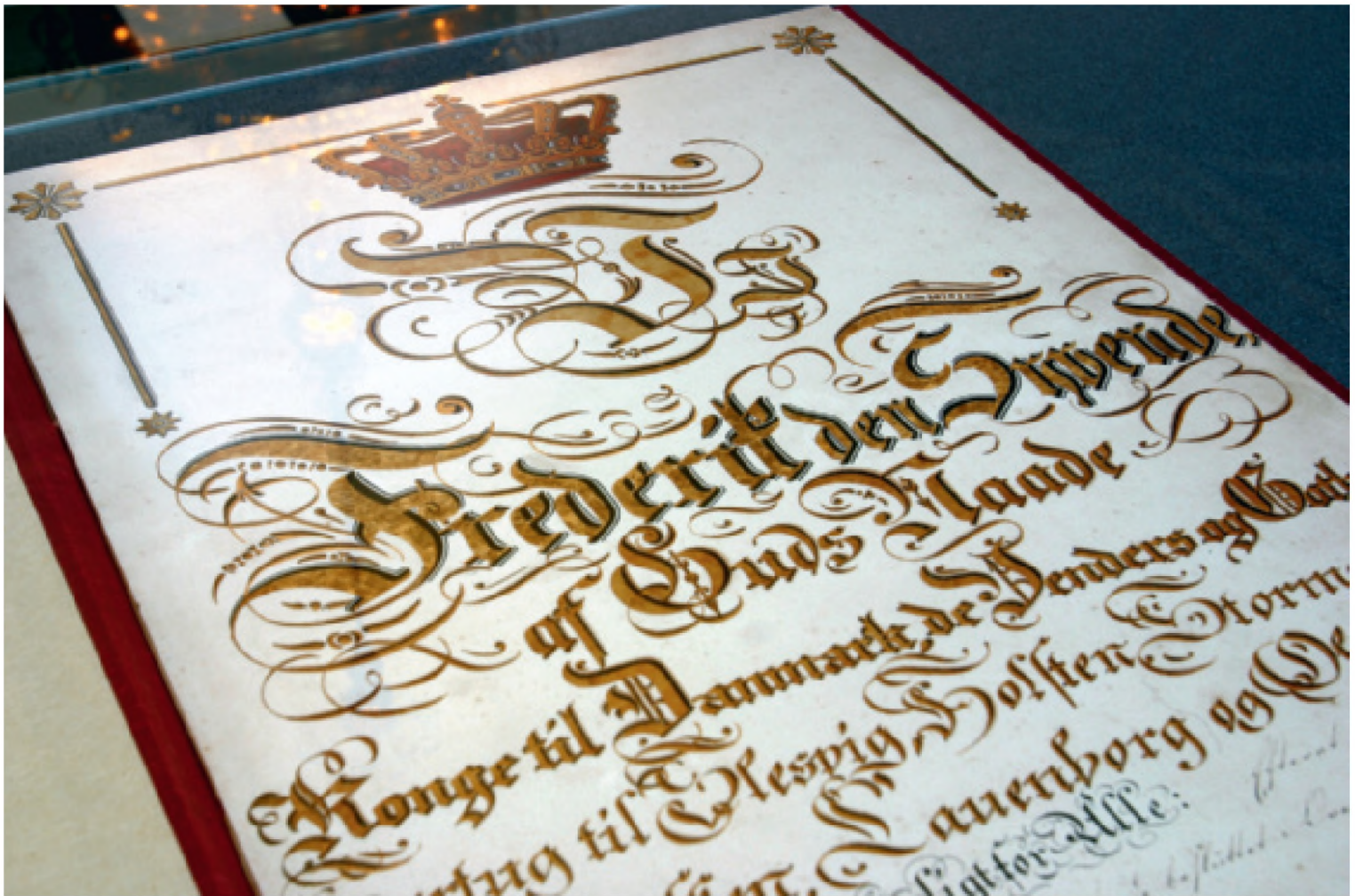
FIGUR 8. Danmarks Rigs Grundlov, der blev undertegnet af Frederik VII den 5. juni 1849, kan i lighed med sine efterfølgere bese i sin glasmonter i Folketingets Vandrehal. Grundlovsværket af 1849 hentede især inspiration fra den belgiske forfatning af 1831, men var også påvirket af den norske Eidsvoll-forfatning af 1814. Det forberedende arbejde blev gjort i Den Grundlovgivende Rigsforsamling; men selve lovtæksten skyldes især de nationalliberale ledere, D.G. Monrad og Orla Lehmann. Større grundlovsændringer har siden fundet sted i 1866, 1915 og 1953. I sidstnævnte blev parlamentarismen som gældende statsskik for første gang indskrevet.

fatning, der byggede videre på stænderprincippet og dermed overførte formel magt fra kongen til folkevalgte stænderdeputerede.