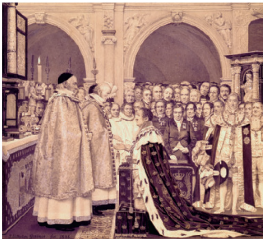
FIGUR 7. Christian VIII's højtidelige salving som enevoldskonge i Frederiksborg Slotskirke den 28. juni 1840 var den sidste af sin art i Danmark. Salvingsceremonien fandt sted under udfoldelse af et stort ceremoniel, hvori medvirkede adskillige Elefantriddere og andre højtstående dignitarere. Selve salvingen forrettedes af Sjællands biskop J. P. Mynster, der her ses i gang med ceremonien foran den knælende konge. Blandt tilskuerne til handlingen genkendes N. F. S. Grundtvig, H. C. Ørsted, Adam Oehlenschläger og H. C. Andersen; men for hovedparten af befolkningen forekom hele det pompøse ritual fremmedartet og anakronistisk, hvilket gav sig udtryk i en offentlig latterliggørelse og en folkelig uvilje, der kom til at klæbe ved Christian VIII i resten af regeringstiden. Belært af disse uheldige erfaringer undlod man en tilsvarende ceremoni ved tronskiftet i 1848. Christian VIII's salvingsfest blev dermed enevældens sidste større selvszenesættelse – tiden var i realiteten løbet fra den og dens magtsymbolik. Tegning med lavering af J. V. Gertner.

I de sidste par år af sin regeringstid syntes han dog i stigende grad indstillet på at bøje sig for det tilsyneladende uundgåelige, nemlig den demokratibølge, der i disse år med stor kraft skyllede ind over Europa og også gav tydelig genlyd i den danske konges riger og lande, ikke mindst i Hertugdømmerne. Efter flere tilløb overdrog kongen således i slutningen af 1847 den statsretskyndige jurist P. G. Bang, som tillige var kongelig kommissarius ved kongerigets stænderforsamlinger, den opgave at udarbejde en samlet betænkning om forfatningsspørgsmålet med frihed til også at ytre sig om forandringer i Kongeloven. Meningen var, at de egentlige forhandlinger om en ændret forfatning på grundlag af Bangs betænkning skulle indledes straks efter nytår 1848; men den 5. januar 1848 blev kongen pludselig alvorligt syg, og det kom derfor ikke til nogen egentlig drøftelse, inden kongen afgik ved døden den 20. januar. Forinden nåede Christian VIII dog den 9. januar at skrive et brev til sin søn og efterfølger, Frederik VII, hvori han indtrængende henstillede til tronfølgeren straks efter sin tronbestigelse at »tilsige det danske Folk og Hertugdømmerne en fælles konstitutionel Forfatning«. På dødslejet indså Christian VIII således, at en indskrænkning af kongens magtfuldkommenhed var blevet en nødvendighed; men han understregede samtidig, at den friere forfatning skulle være fælles for alle rigets dele, og markerede dermed en klar afstandtagen fra de Nationalliberales Ejerdanske program.